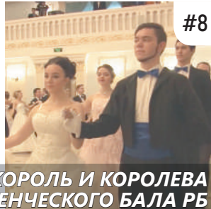
КОРОЛЬ И КОРОЛЕВА ЕЖЕГОДНОГО СТУДЕНЧЕСКОГО БАЛА РБ

В общекомандном зачете спортсмены БГМУ заняли I место в Первом Всероссийском турнире по кикбоксингу среди студентов медицинских и фармацевтических вузов РФ.