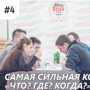
САМАЯ СИЛЬНАЯ КОМАНДА ПФО ПО ИГРЕ «ЧТО? ГДЕ? КОГДА?» - «ПРОТЕЗ МОЗГА»

Команда БГМУ «Протез мозга»-победитель Республиканской интеллектуальной игры «Что?Где?Когда?» - заняла I место и признана самой сильной среди команд региона.