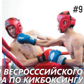
ПОБЕДИТЕЛИ ВЕСРОССИЙСКОГО ТУРНИРА ПО КИКБОКСИНГУ

Сборная команда БГМУ по плаванию заняла I место в общекомандном зачете среди студентов медицинских и фармацевтических вузов ПФО России.