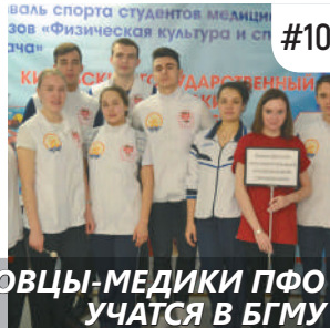
ЛУЧШИЕ ПЛОВЦЫ-МЕДИКИ ПФО УЧАТСЯ В БГМУ